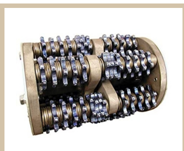
Estrellas EDCO escarificador de carburo tungsteno