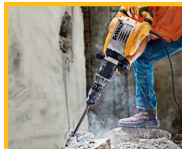
Demolición de hormigón